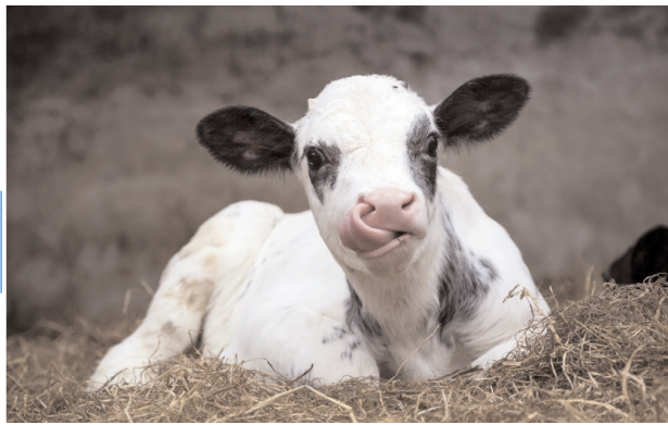
Preventie van luchtweginfecties door NH3 monitoring

De ammoniak-emissies zijn afkomstig van metabolische activiteiten gerelateerd aan bacteriën in de veehouderij van pluimvee, runderen en varkens. Ventilatie in de stallen moet worden beheerd om kritieke blootstelling van dieren aan ammoniak te voorkomen wat op lange termijn resulteert in stress en ontstekingen bij dieren, verminderde gezondheid en productiviteit. Het is zinvol om de concentraties ammoniak te monitoren en het meetsignaal te koppelen aan de ventilatie. Processen kunnen zo inzichtelijk gemaakt worden en het klimaat wordt via de klimaatcomputer volautomatisch verbeterd door de ventilatie in de stal te sturen op basis van de ammoniak concentratie. Hierdoor worden processen en dierwelzijn verbeterd. Dit resulteert uiteindelijk in lagere kosten en hogere kwaliteit en productie.